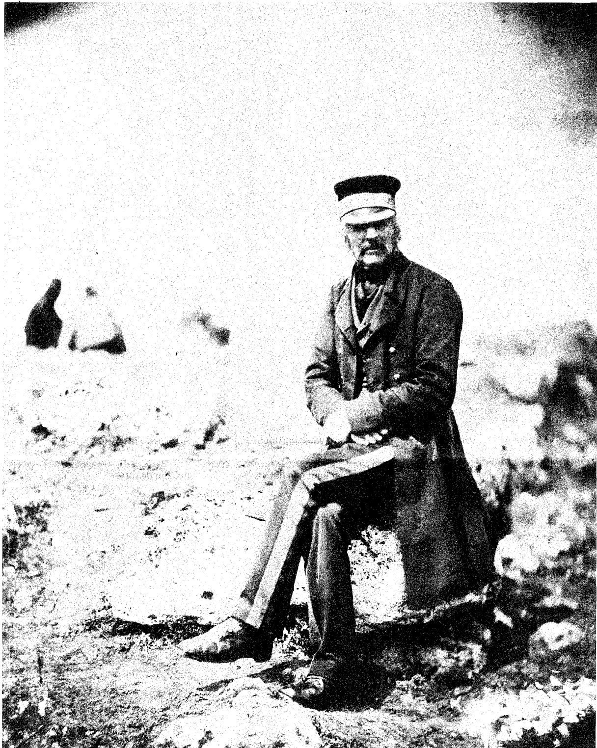
De Britse luitenant-generaal Sir J. L. Pennefather op de Krim in 1855.